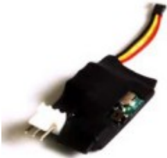
1. RT-99 Sensor