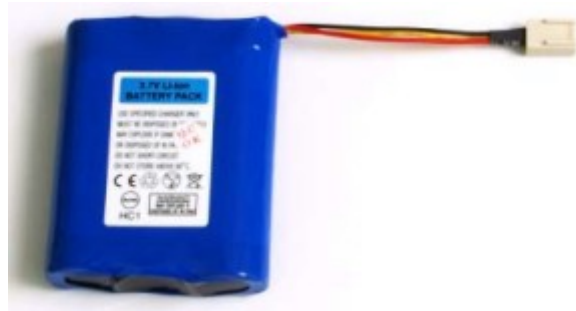
2. 6600mA Akku